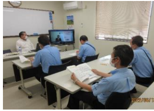
バス運転者の労働時間研修