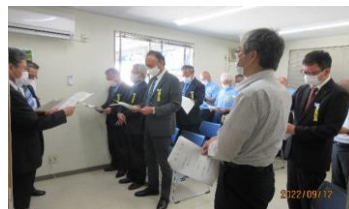
秋季事故防止大会