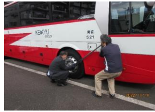
グリップ・ナット増締め確認