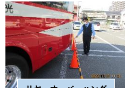
リヤ・オーバーハング