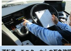
運転席・モニターからの死角確認