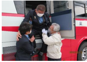
バス非常口脱出訓練